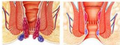
قبل از عمل